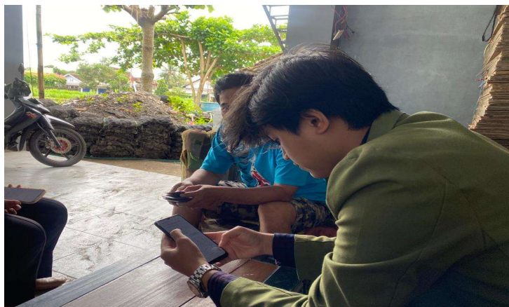
Gambar 2. Penyuluhan Kepada UMKM “Quin Koi Farm” Terkait NIB

Dalam tahap ini kelompok 40 melakukan Penyuluhan kepada UMKM “Quin Koi Farm” terkait Edukasi Legalitas NIB, pengertian mengenai Nomor Induk Berusaha, manfaat Nomor Induk Berusaha serta pentingnya Nomor Induk Berusaha untuk usaha pada UMKM “Quin Koi Farm”. Kemudian Kelompok 40 memberikan sesi tanya jawab apabila terdapat hal yang belum di pahami oleh UMKM “Quin Koi Farm”. Selanjutnya kelompok 40 memberikan arahan serta menjelaskan dokumen apa saja yang dibutuhkan untuk mengisi form Online Single Submission (OSS) .