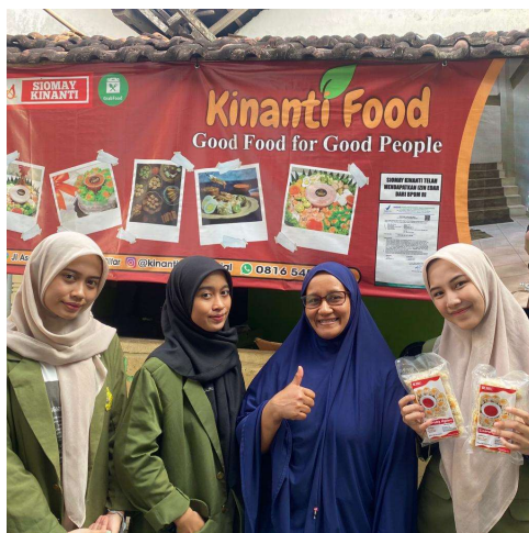
Gambar 1. Kegiatan Survey UMKM oleh KKNT Kelompok 40