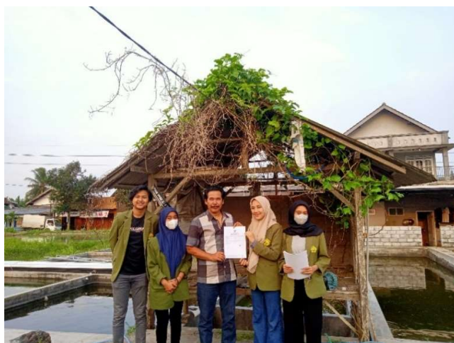
Gambar 4. Penyerahan NIB kepada UMKM Quin Koi Far