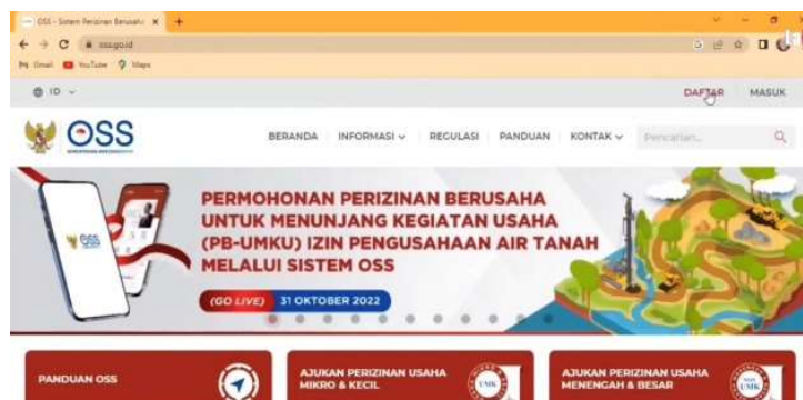
Gambar 3. Tampilan Website Online Single Submission (OSS)

KBLI adalah kode klasifikasi yang diatur oleh lembaga pemerintah nonkementerian yang menyelenggarakan urusan pemerintahan di bidang statistik. Kode KBLI berfungsi sebagai pemetaan izin usaha yang akan diberikan kepada pelaku usaha (Fatchullah, & Sa'adah, N,2022). Pada saat memasukkan data KBLI, diterbitkan Nomor Induk Perusahaan (NIB). Berikut tampilan website OSS pada saat proses pembuatan Nomor Induk Berusaha (NIB).