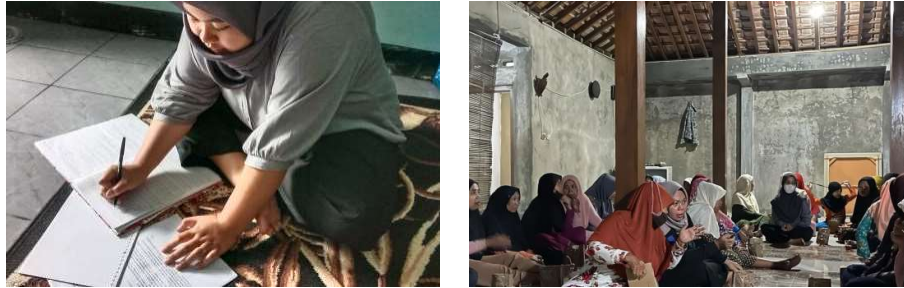
Gambar 1. Pemberian Latihan Pencatatan

penyusunan laporan keuangan secara langsung agar penyampaian materi lebih maksimal. Selanjutnya pelaku UMKM diberikan pelatihan terkait pencatatan transaksi dan penyusunan laporan keuangan. Selain itu juga diberikan pemahaman terkait pentingnya pemisahan keuangan keluarga dan keuangan bisnis agar pengeluaran dan pemasukan keuangan jelas.