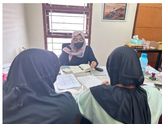
Gambar 4: Kegiatan Pendampingan Perhitungan Harga Pokok Produksi UMKM Pawon 35