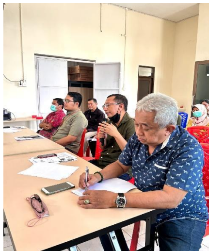
Gambar 2: Kegiatan Forum Grup Discussion

Hasil dari pendekatan tersebut tim pengabdian mengumpulkan data-data pembukuan pelaku UMKM salah satunya terkait pembukuan perhitungan Harga Pokok Produksi (HPP). Dalam perhitungan HPP pelaku UMKM tidak menyantumkan biaya tenaga kerja, biaya listrik, biaya promosi, biaya penyusutan alat atau mesin sehingga tim pengabdian memberikan solusi dari permasalahan perhitungan Harga Pokok Produksi yang dihadapi oleh UMKM berupa kegiatan pelatihan dan pendampingan perhitungan Harga Pokok Produksi (HPP). Kegiatan hari pertama pelatihan pada tanggal 20 Mei 2023 dipaparkan materi secara tatap muka langsung mengenai Harga Pokok Produksi (HPP) dengan metode full cost dengan tujuan UMKM di Kelurahan Klampis Ngasem tidak kesulitan dalam melakukan praktik perhitungan Harga Pokok Produksi (HPP) dan mampu memperkirakan laba serta menentukan harga jualnya.