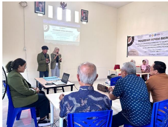
Gambar 3: Kegiatan Pelatihan Perhitungan Harga Pokok Produksi