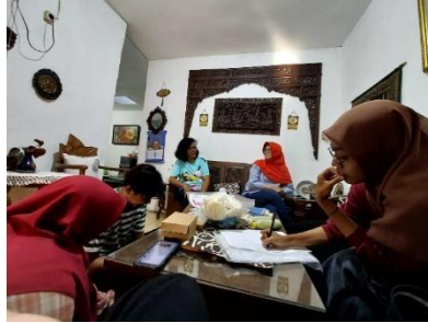
Gambar 1: survey dan wawancara secara door to door

dikarenakan kurangnya pemahaman mengenai pencatatan yang sesuai dengan Prinsip Akuntansi Berterima Umum (BUPU). Pendekatan yang dilakukan oleh tim KKN-T MBKM untuk memberikan pelatihan terkait perhitungan Harga Pokok Produksi (HPP) adalah berupa survei dan wawancara langsung secara door to door dengan pelaku UMKM serta Fokus Group Diskusi (FGD).