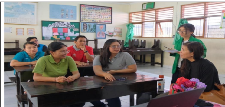
Gambar 1. Diskusi dan wawancara permasalahan yang dihadapi guru

Kegiatan Pengabdian kepada Masyarakat ini sudah dilakukan sesuai dengan analisis situasi di lapangan. Survei dan pemetaan yang dilakukan di awal pengabdian menunjukkan bahwa kompetensi guru di SD 11 Dauh Puri di bidang IT dan pemanfaatan teknologi perlu dilakukan. Salah satu keluhan guru adalah terbatasnya pembuatan materi ajar dan keterbatasan waktu untuk melakukan assessment atau penilaian. Pengabdian kepada Masyarakat melalui pendampingan dan pemanfaatan canva serta quizziz untuk pembuatan bahan ajar disambut baik oleh guru-guru. Guru merasa terbantu, meskipun sudah mendapatkan pelatihan dari pemerintah. Berikut adalah salah satu dokumentasi pendampingan dan sosialisasi di SD 11 Dauh Puri.