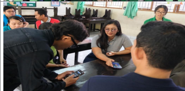
Gambar 3. Mencoba Aplikasi Quizziz Secara Langsung