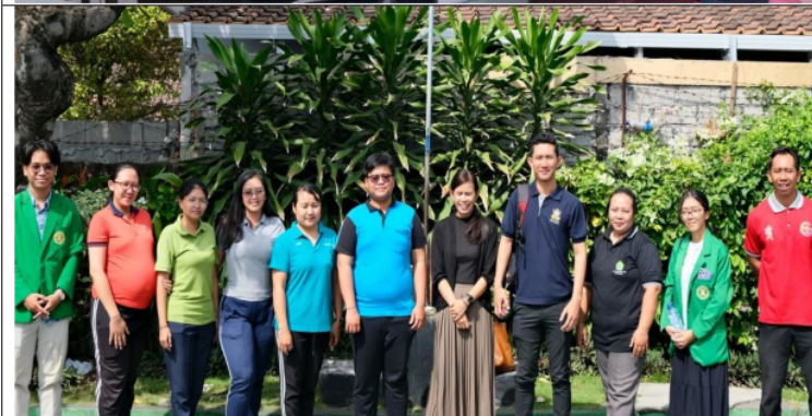
Gambar 2. Foto bersama guru setelah acara pendampingan