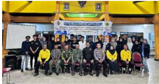
(Gambar sosialisasi judi online dan Narkoba)

Dari gambar tersebut, terlihat bahwa kegiatan yang dilaksanakan adalah sosialisasi mengenai judi online dan narkoba. Sosialisasi “Judi online dan narkoba” ini berhasil memperluas wawasan Masyarakat mengenai dampak buruk dari perjudian online dan penyalahgunaan narkoba, baik penanggulangan secara ekonomi, sosial maupun kesehatan. Edukasi dilakukan melalui seminar dan melibatkan Kapolsek Kemlagi, Dosen Universitas Mayjen Sungkono dan Mahasiswa. Ini merupakan Langkah penting untuk meningkatkan kesadaran Masyarakat tentang dampak dari Tindakan tersebut. Berikut beberapa poin yang bisa ditekankan dalam sosialisasi ini: